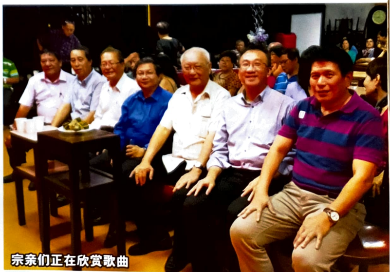
宗亲们正在欣赏歌曲